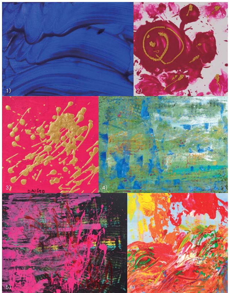
1) umi 2) cosmos 3) cosmos 4) yama*sora*kaze 5) hotaru 6) flowers of Hawaii